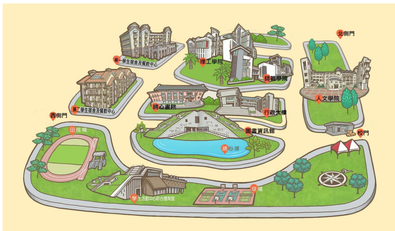
國立臺東大學校本部(知本校區)校園配置圖